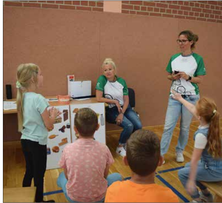
Die Grundschüler haben eine Menge gelernt über gesunde Zähne.