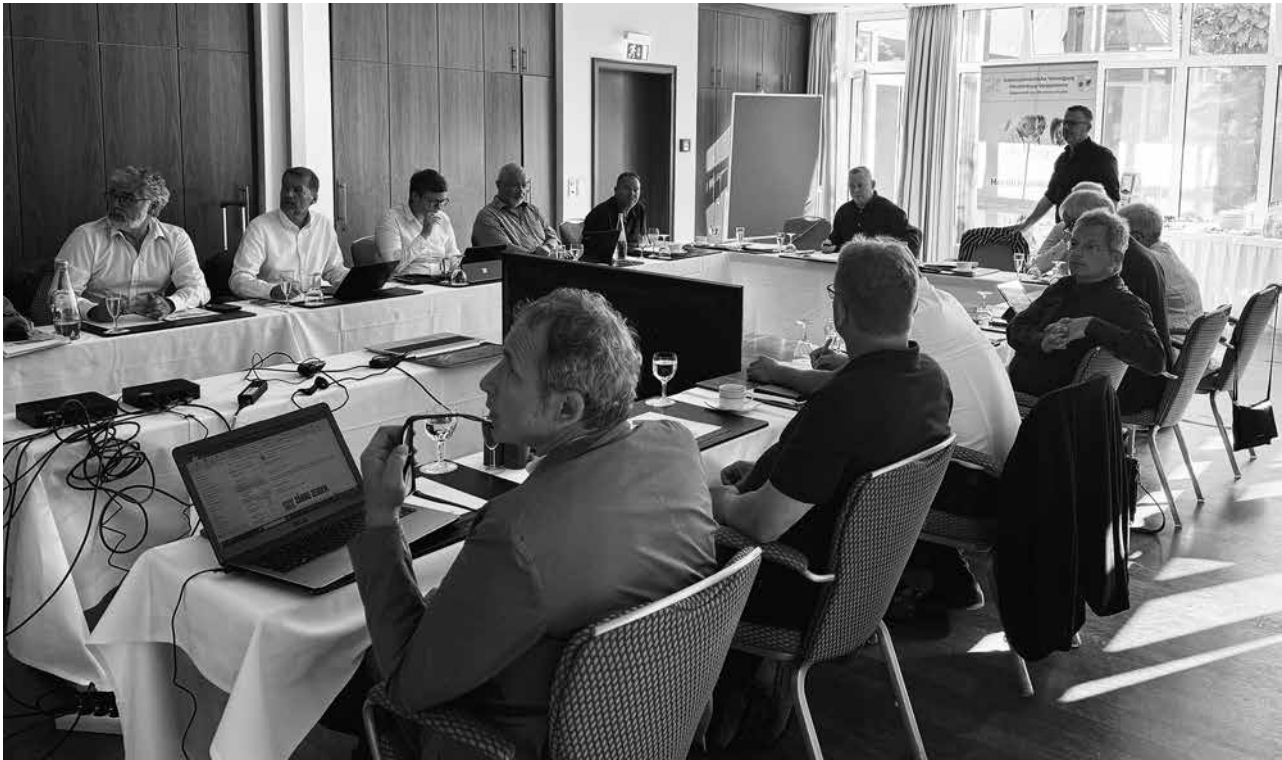
Der fachliche Austausch stand bei dieser Koordinierungskonferenz der Vorstände Ost-KZVs im Vordergrund.