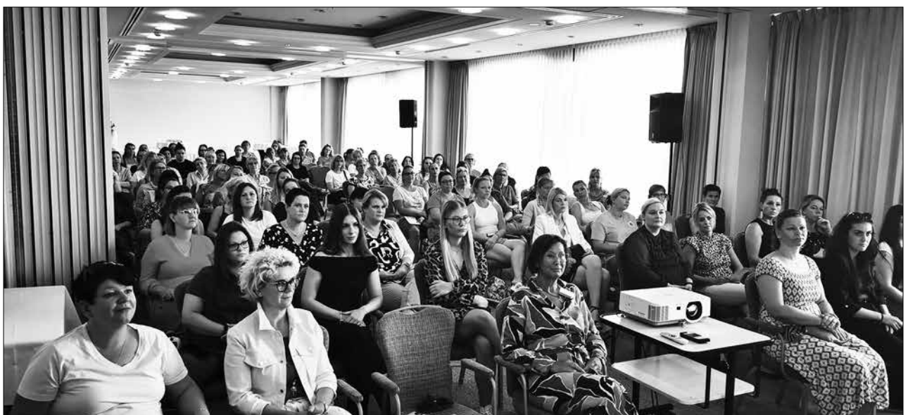
Die Fortbildungstagung war trotz des Strandwetters sehr gut besucht