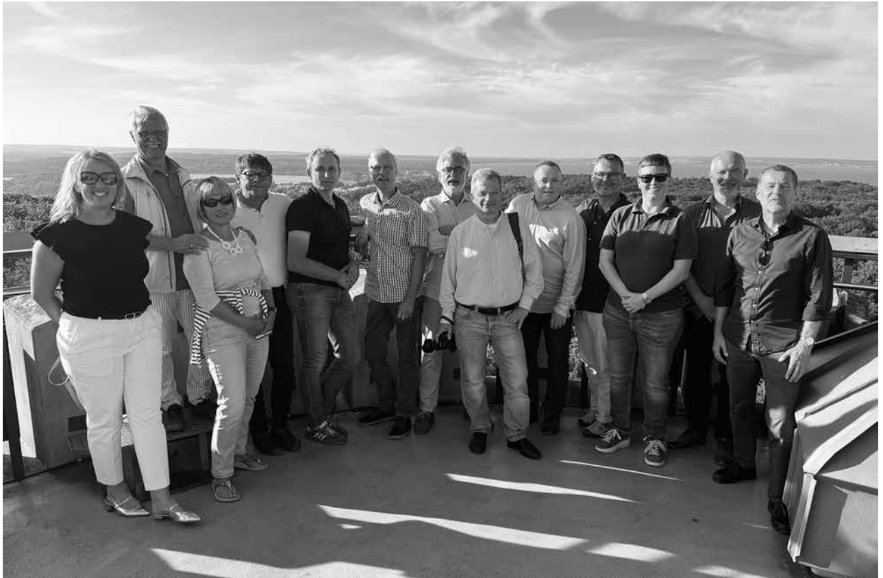
Ein atemberaubender Blick bot sich den Teilnehmern hoch oben vom Jagdschloss Granitz