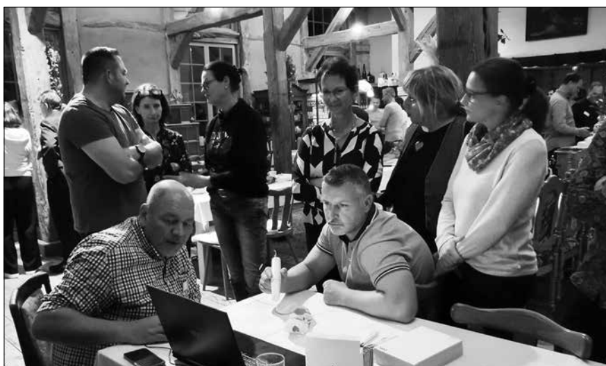
Interessierte Teilnehmer konnten die funktionstüchtigen Intraoralscanner auf Herz und Nieren prüfen.