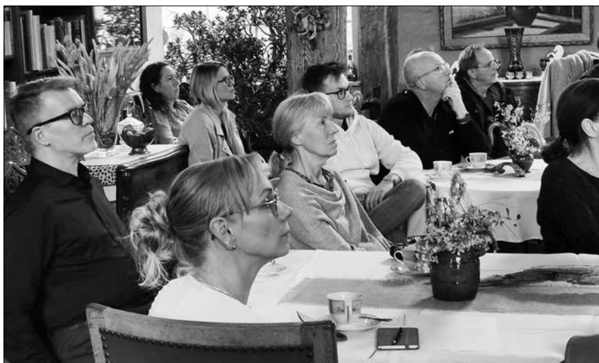
Am Ende saßen alle wieder vereint am großen Essenstisch. In entspannter Atmosphäre tauschten sich die „Newbies“ mit den alten Hasen aus.