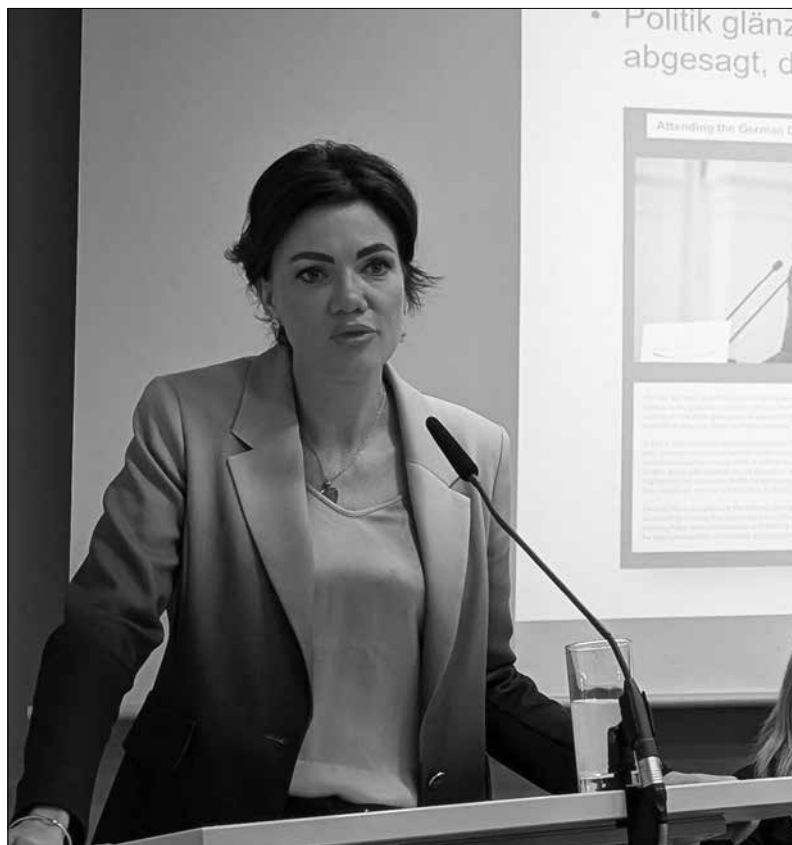
Die Präsidentin der Zahnärztekammer bei ihrem Bericht