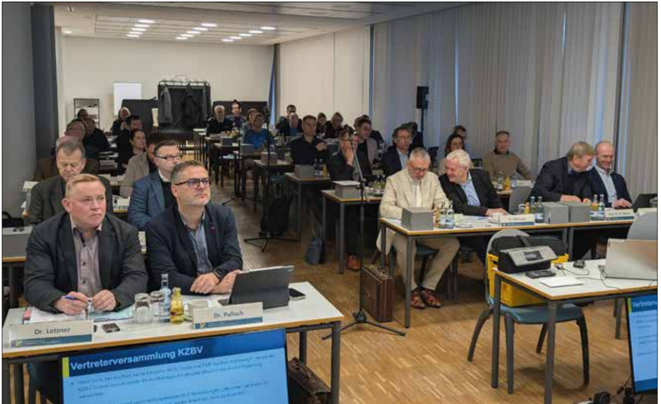
Die Kammerversammlung fand diesmal an zwei Tagen statt.