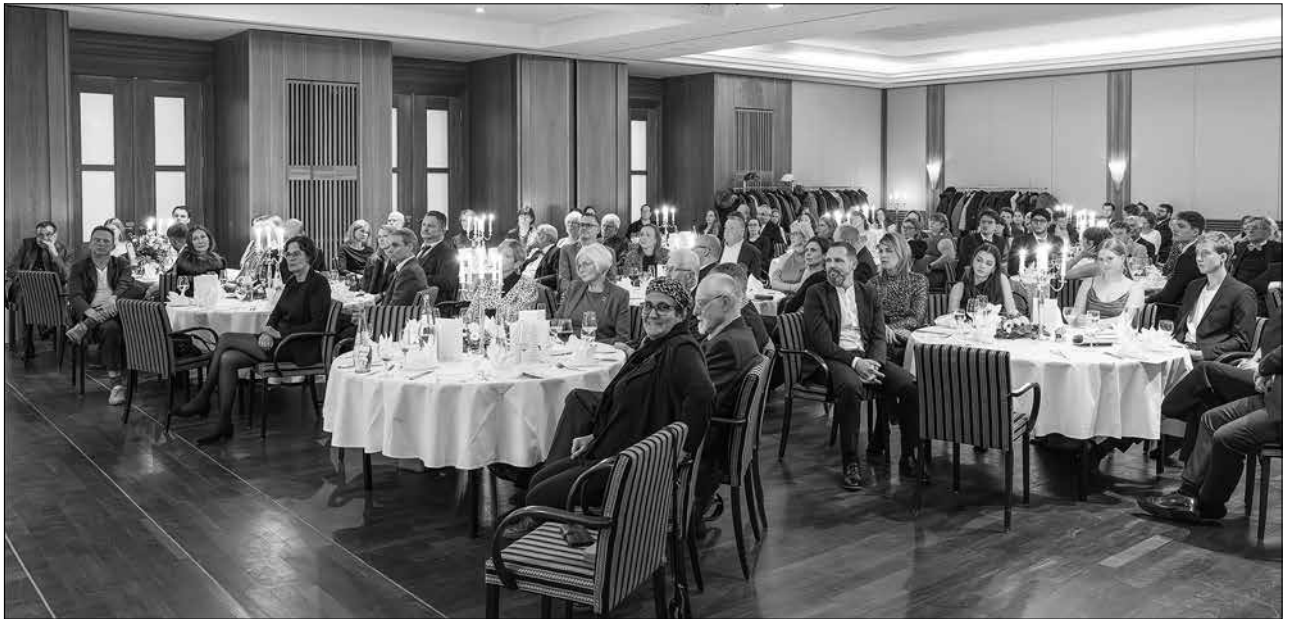
Während der Festveranstaltung des Fördervereins der Universitätsmedizin Rostock